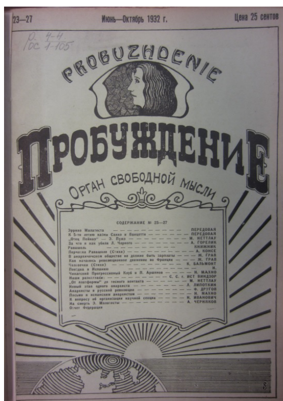
Рис. 2. Титульная страница журнала «Пробуждение» (1932, № 23–27)