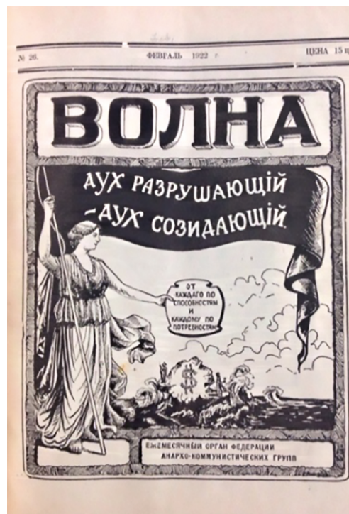
Рис. 2. Журнал «Волна»