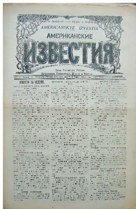
Рис. 1. Газета «Американские известия»